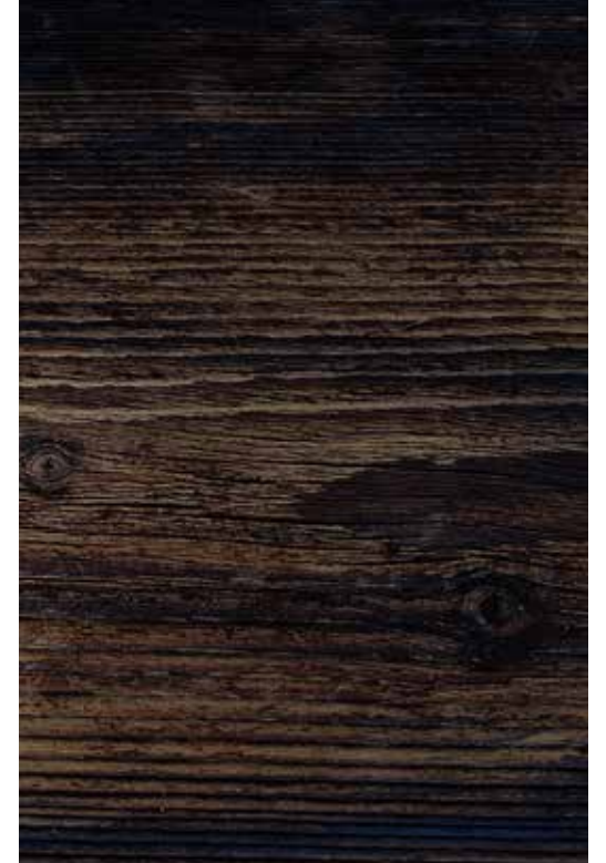
Tallado- Carpintería // Madera