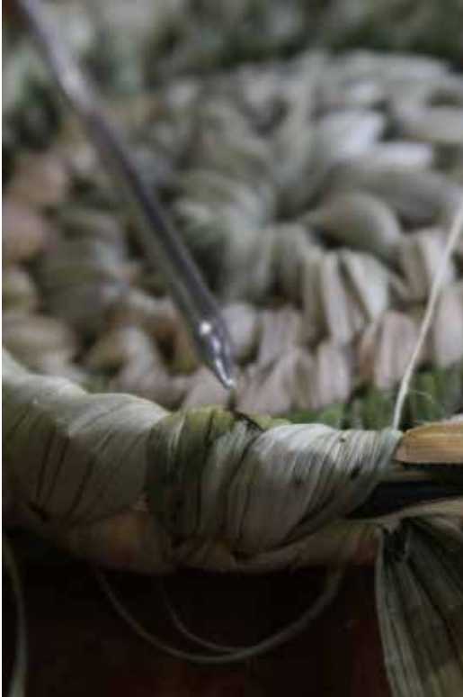
Cestería // Fibra Vegetal