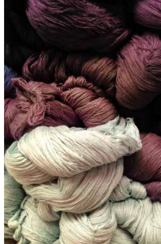
Teñido Natural - Tejido // Lana