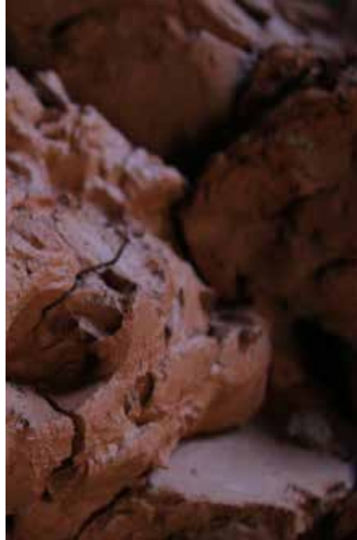
Alfarería // Greda