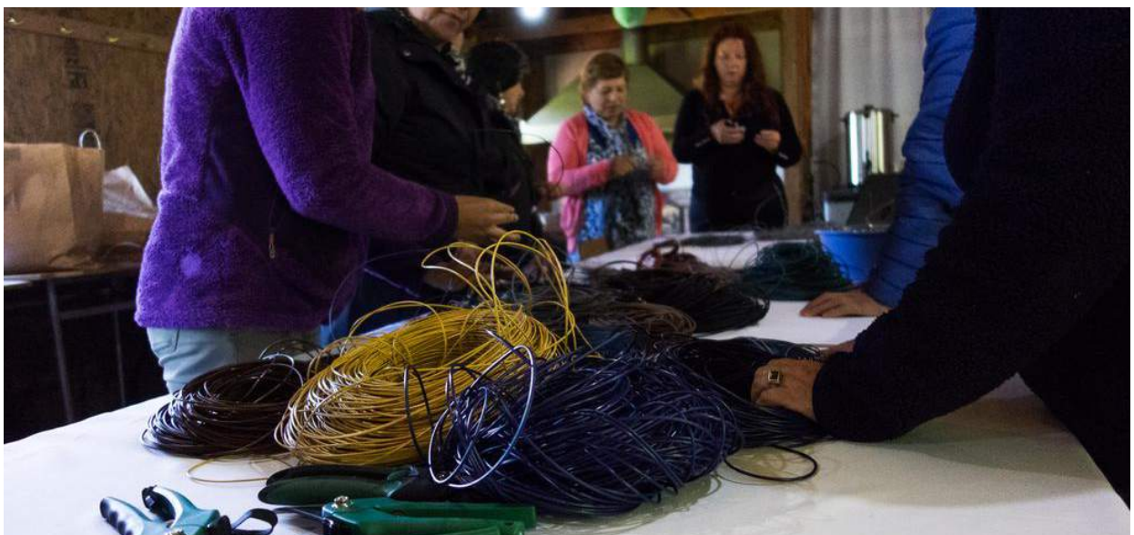
Sesiones de trabajo junto a artesanas y artesanos.