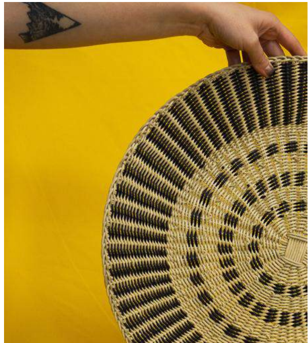
Centro Boqui inspirado en el balai tradicional.