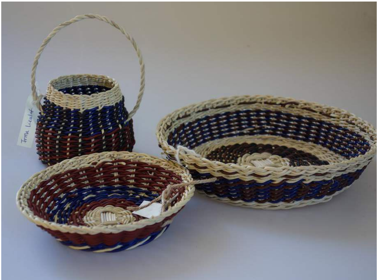
Primeros prototipos realizados por la Agrupación de Artesanos de Mariquina.