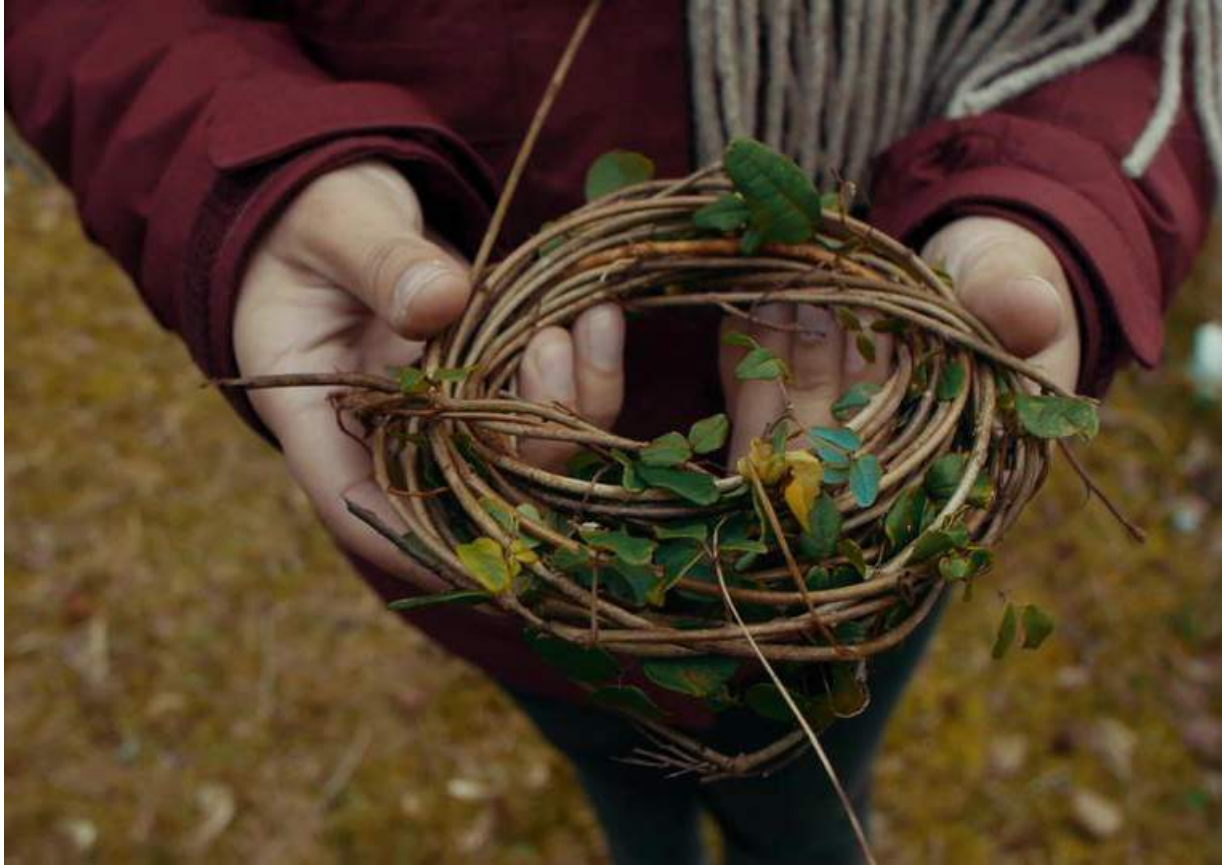
Fibra vegetal boqui pil pil, recolectada en los montes de la costa valdiviana.