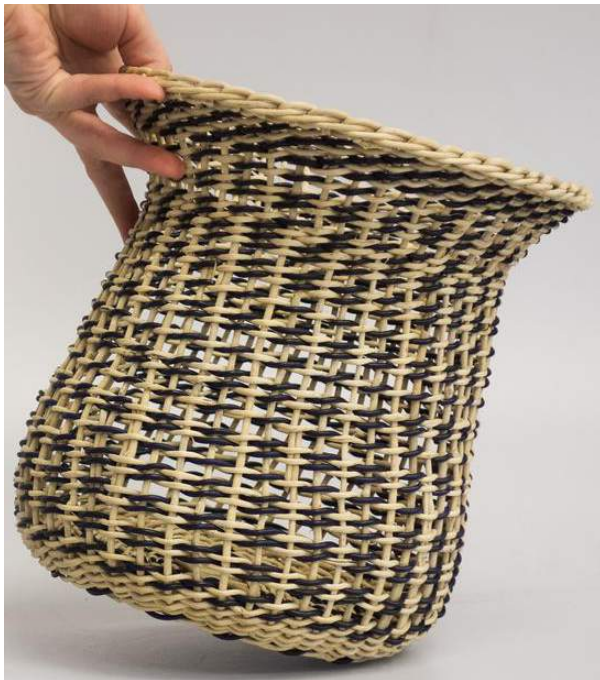
Florero Boqui inspirado en el chaihue tradicional.

objeto utilizado principalmente para aventar y limpiar cereales y granos.