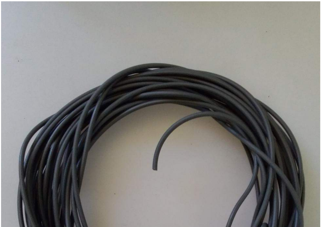
Fibra LUP n°4. Hecha con residuos plástticos de LDPE.