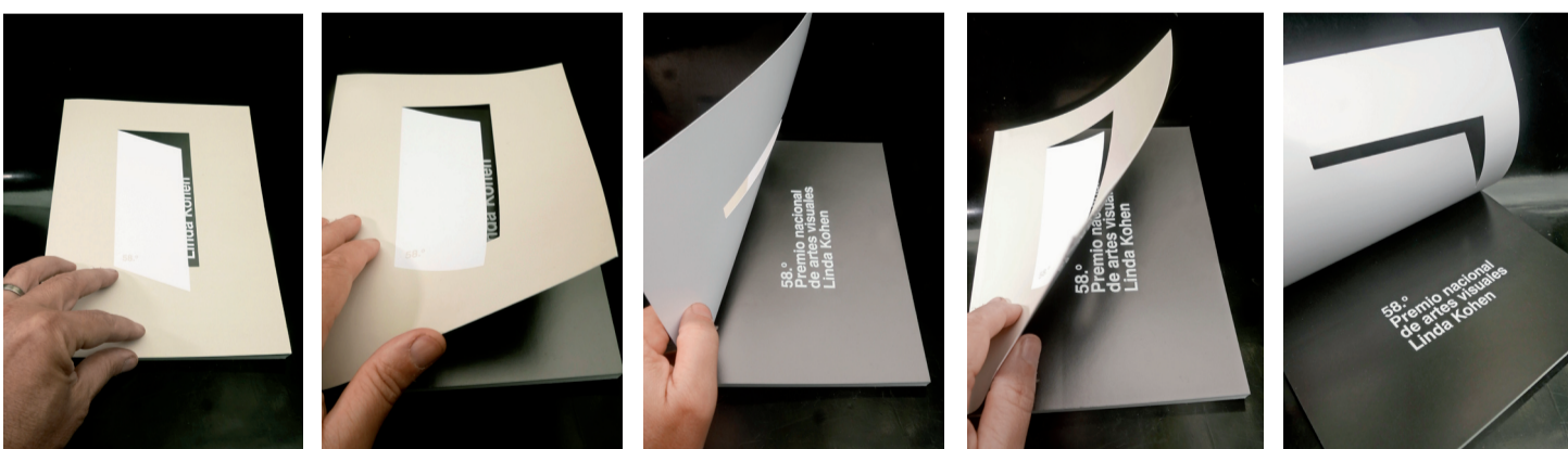
Tapa y segunda tapa