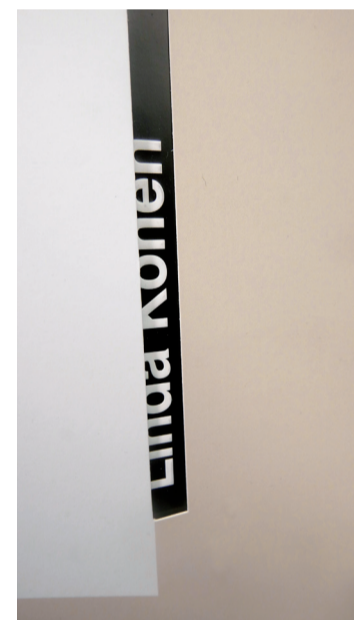
Detalle de la doble tapa, el caladado y el golpe en seco