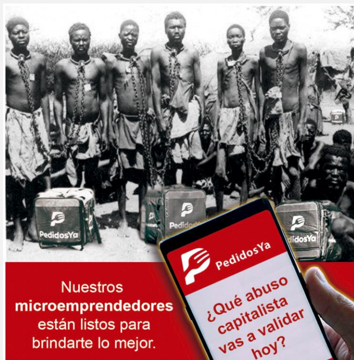
▲ “Microemprendedores” Collage digital (2020) Autoría: Colectivo Proyecto Squatters