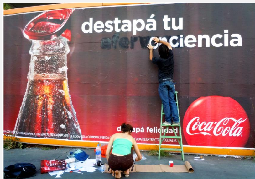
▲ “Destapá tu conciencia” Intervención sobre cartel de publicidad (2016) Autoría: Colectivo Proyecto Squatters