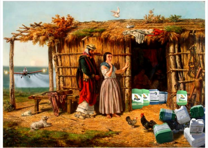
▲ “Idilio Criollo” Collage digital (2020) Autoría: Colectivo Proyecto Squatters