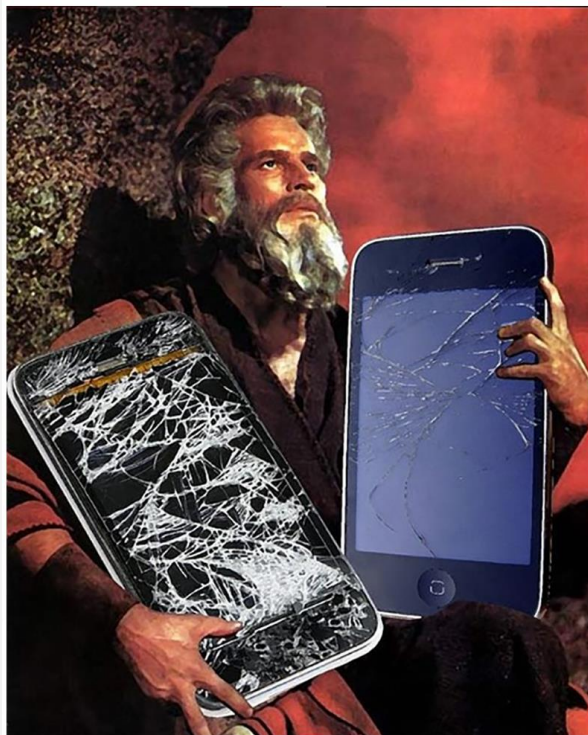
▲ “Las nuevas tablas” Collage digital (2018) Autor: Osa_Cra - Artista digital (Perú)