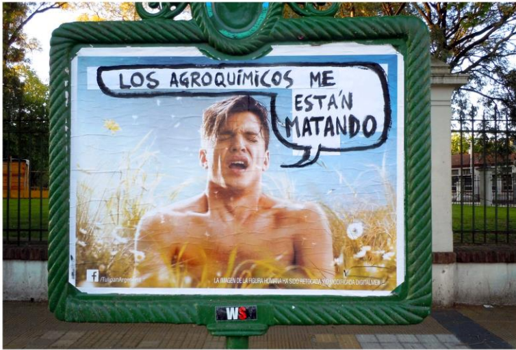
▲ “Agroquímicos” Intervención sobre cartel de publicidad (2014) Autoría: Colectivo Proyecto Squatters