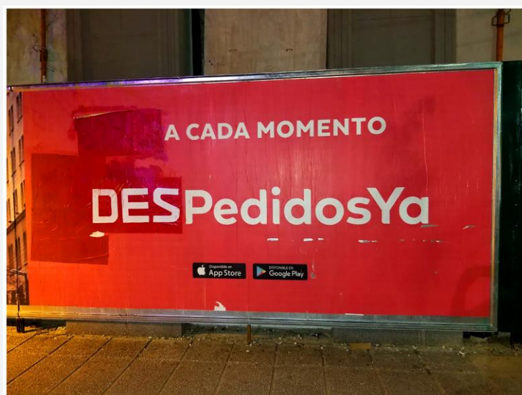
▲ “DespedidosYa” Intervención sobre cartel de publicidad (2018) Autoría: Colectivo Proyecto Squatters (Santa Fe, Argentina)