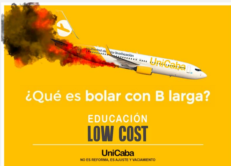
▲ “Educación LowCost” Collage digital (2018) Autoría: Colectivo Proyecto Squatters