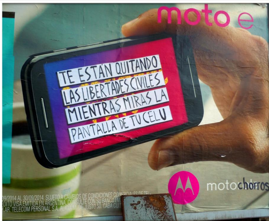
▲ “Libertades Civiles” Intervención sobre cartel de publicidad (2014) Autoría: Colectivo Proyecto Squatters